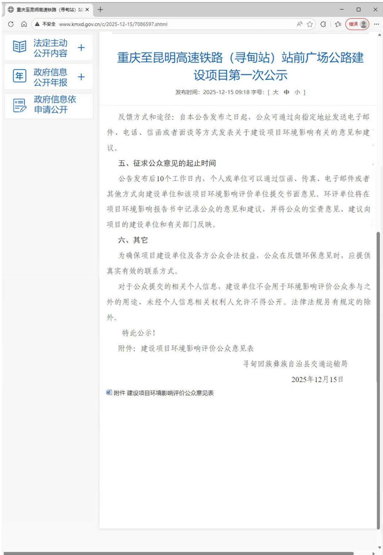
附图 2.2-1 第一次公示截图