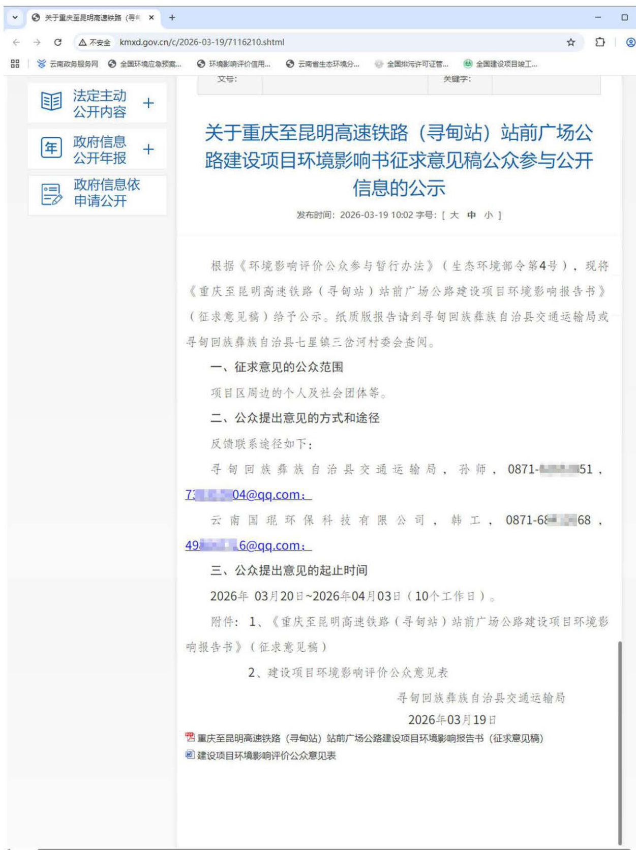
图 3.2-1 征求意见稿网络公示截图